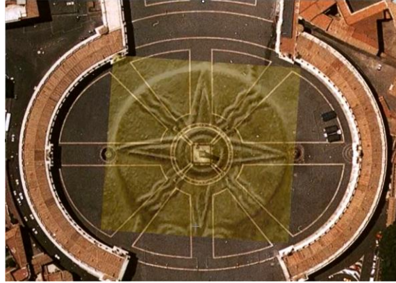
Le Vatican vénère également le dieu Saturne