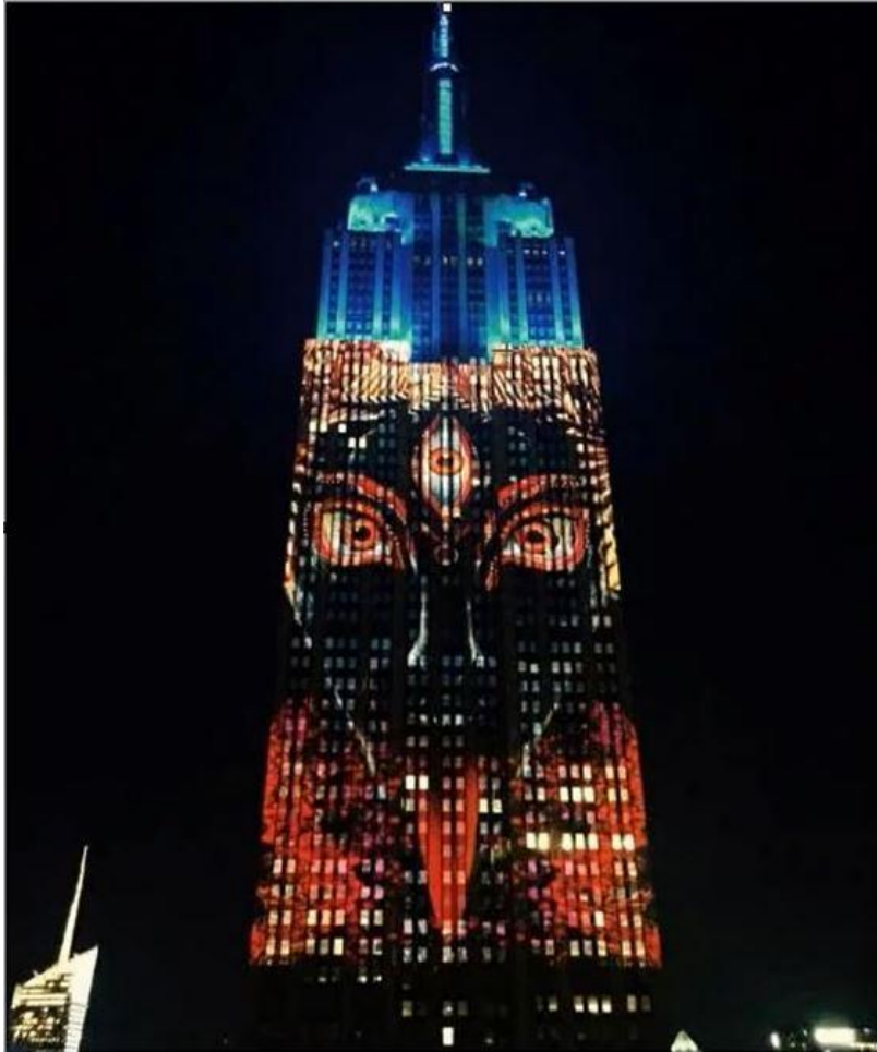
En haut le bleu, au centre les 3 yeux blancs sur fond noir et au bas le rouge sacrificiel.